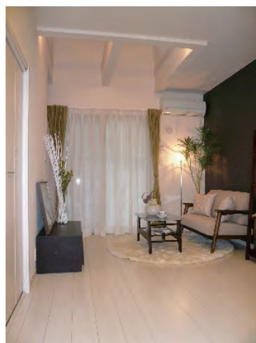
7帖超の居室 ミニファミリー向け

お部屋のひとつひとつに、趣向をこらしたプランニング SINGLEやDINKS向けに。 タテに広がる、暮らし提案型のテラススタイル。