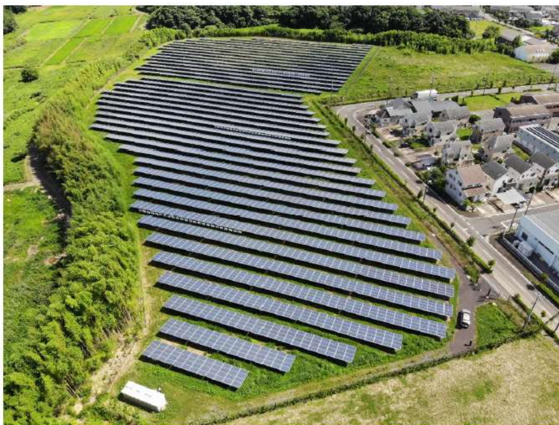
東栄住宅龍ヶ崎市太陽光発電所(茨城県龍ヶ崎市松ヶ丘四丁目3-3)